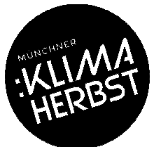
Abb. Vorderseite: